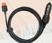
車載充電ケーブル